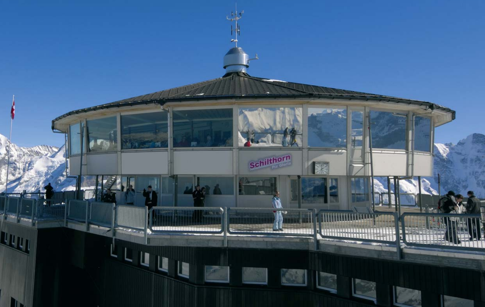
Systemarchitektur Schilthornbahnen AG